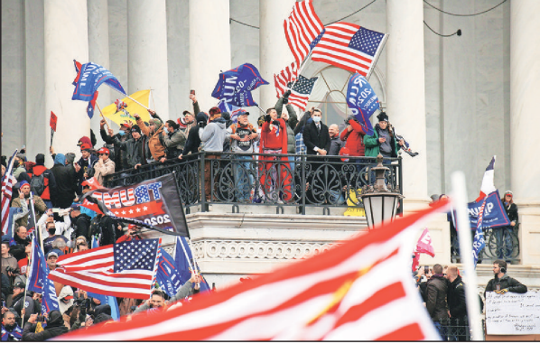
Previously unseen videos showed the view from inside the Capitol as rioters fought with police

House managers prosecuting the case frequently high-